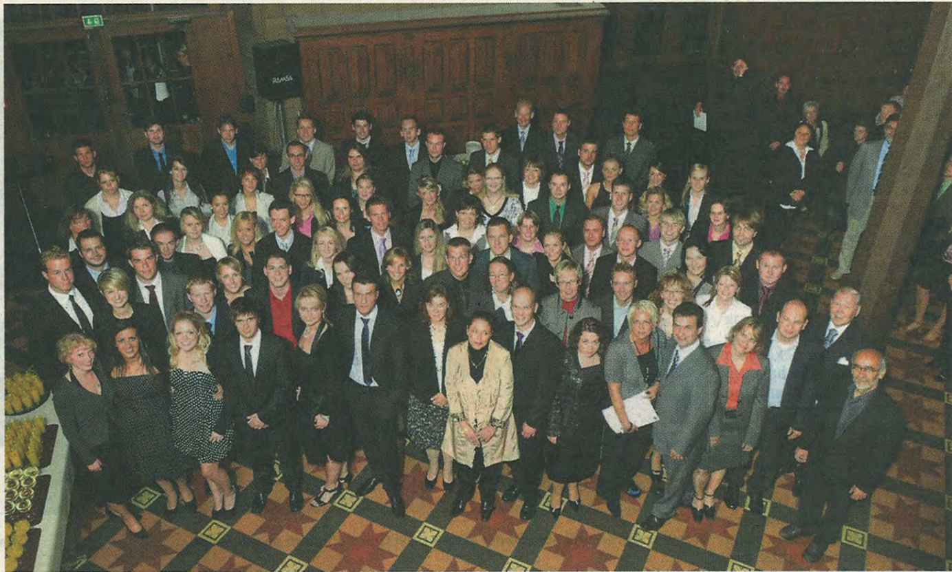
Verabschiedung im Alten Rathaus: Absolventen der VWA und der Betriebsakademie treffen sich zum letzten Gruppenfoto.

Niedriger war die Erfolgsquote bei den Studierenden der VWA, die nebenberuflich ein dreijähriges betriebswirtschaftliches Studium absolvierten. Nur 50 Prozent haben das Ziel erreicht. 70 Betriebswirte erhielten am Freitagabend ihre Di-