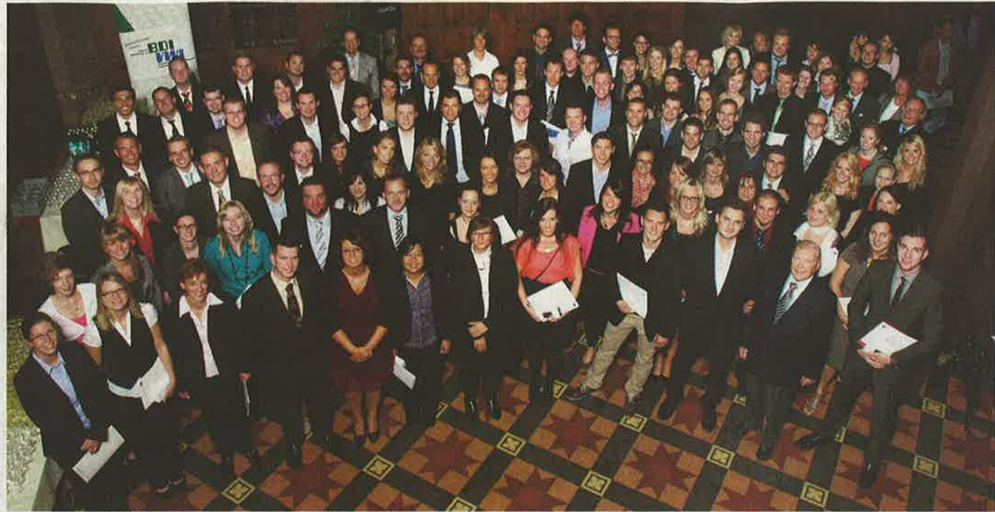
Feiern das Ende ihre Studienzeit und die Übergabe der Diplome: Absolventen im Saal des Alten Rathauses.