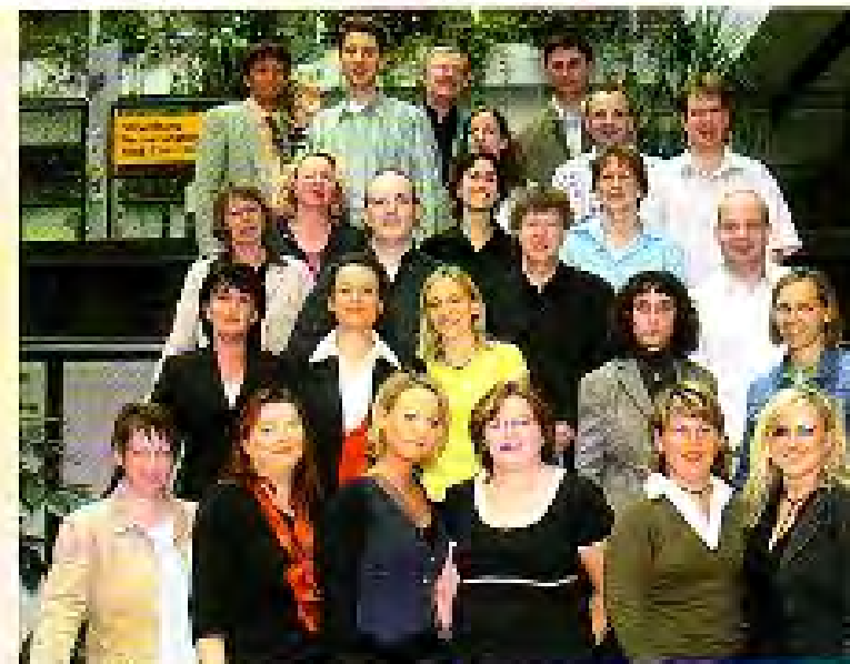
Gruppenfoto der ersten Absolventinnen und Absolventen des Studienganges Gesundheits-Ökonom/in (VWA)

Das Studium beginnt jedes Jahr im Oktober. Ein Schwerpunkt der Ausbildung liegt in den Bereichen Gesundheitsökonomie, Management im Gesundheitswesen und Medizincontrolling. In aufeinander aufgebauten Modulen lernen die Studierenden die theoretischen Grundlagen kennen. Praxisorientierte Übungen geben einen Einblick in den Umgang mit den Instrumenten des strategischen Ma-