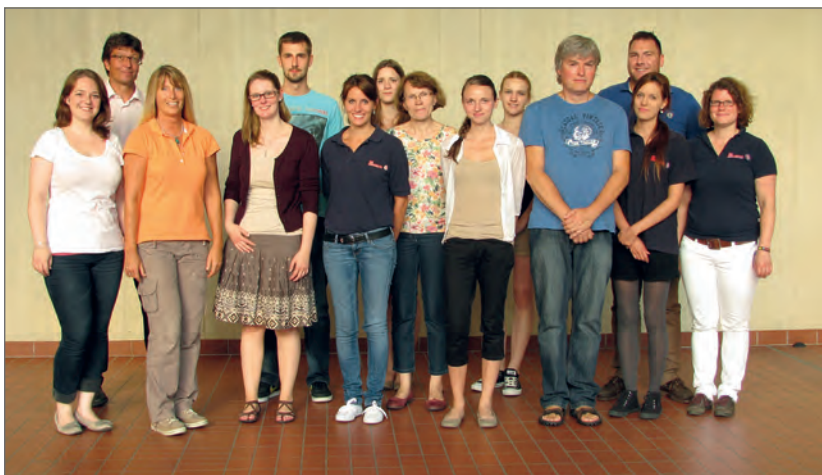
Die Blutspender.

Nach der Blutspende stärkten sich die Spender mit den gesponserten Snacks und Getränken, tauschten sich mit den übrigen Spendern aus und hoffen darauf, dass sie die Gelegenheit bekommen werden, Menschenleben retten zu können.