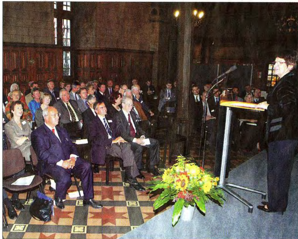
50 Jahre VWA in Göttingen: Rita Süssmuth hält den Festvortrag.

Seit 1954 gibt es in Göttingen die VWA. Ihre Anfänge liegen jedoch weiter zurück: Die erste VWA in Göttingen wurde bereits 1936 gegründet, schloss aber während des Zweiten Weltkrieges. War das Angebot zunächst auf Beamte und Angestellte der öffentlichen Verwaltungen zugeschnitten, öffnete sich die Akademie mit Wiedereröffnung auch für Interessenten aus der Wirtschaft. Heute sind über 500 Studierende mit einem Durchschnittsalter von 27 Jahren in den verschiedenen Studiengänge immatrikuliert, von bundesweit rund 23 000. Im Schnitt 500 Euro kostet ein Studiensemester an der Akademie, die Studiengänge sind auf drei Jahre ausgelegt. Seit 1954 haben 2225 Studenten ihren Abschluss in Göttingen gemacht.