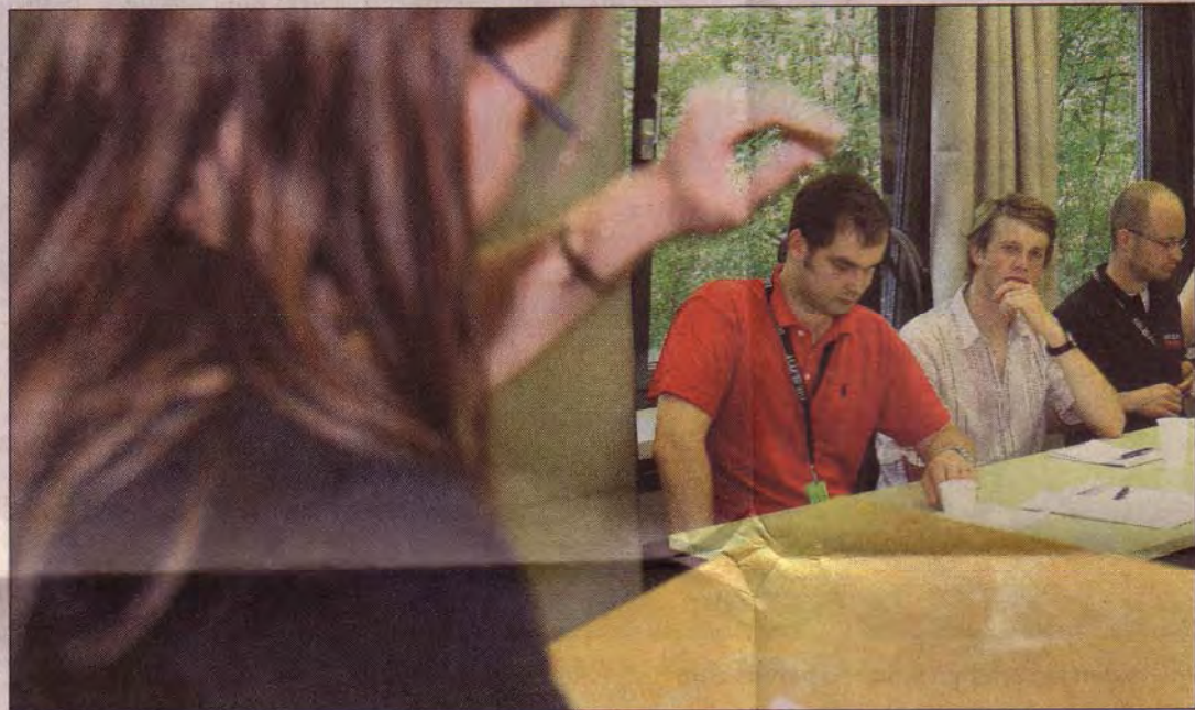
Gute Qualifikation zählt: Berufliche Weiterbildung, zum Beispiel durch berufsbegleitende Studiengänge, ist zwar zeitintensiv, aber karriereförderlich.

Die VWA Göttingen bietet zwei- bis dreijährige Studiengänge in den Bereichen „Betriebswirtschaftslehre“, „Marketing“ und „Wirtschaftsinformatik“ an. In Kooperation mit der Universitätsmedizin Göttingen, Georg-August-Universität werden zwei Studiengänge des „Gesundheitsmanagements“ angeboten. Die Veranstaltungen der berufsbeglei-