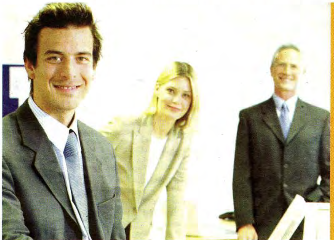
An der Berufsakademie Göttingen wird erstmals ein Bachelorabschluss angeboten.

Um einen Bachelor- oder Master-Studiengang einrichten zu können, ist es notwendig, den Studiengang zu modularisieren und studienbe-