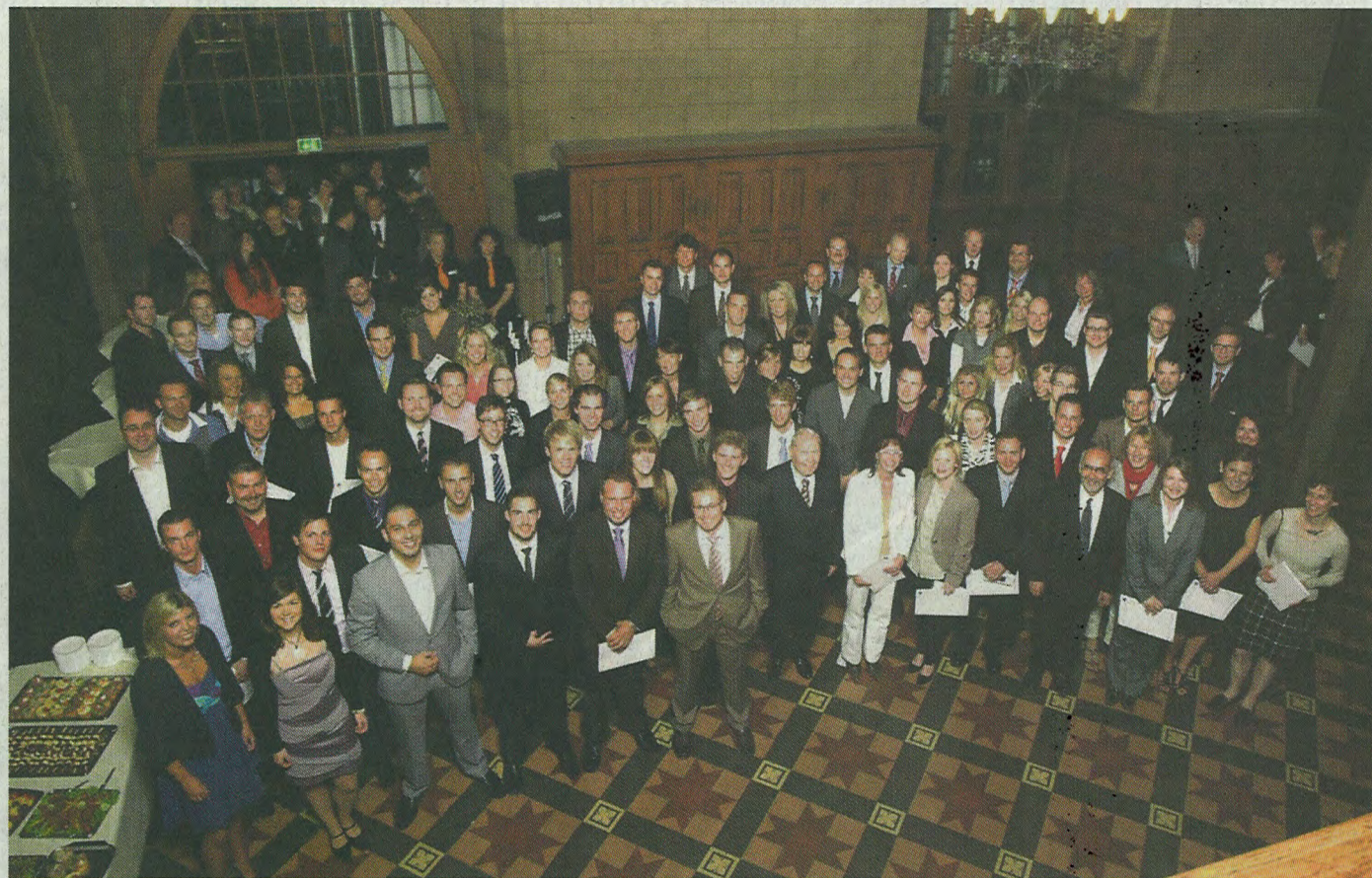
Strahlende Gesichter: erfolgreiche Studienteilnehmer der VWA und der Berufsakademie Göttingen.