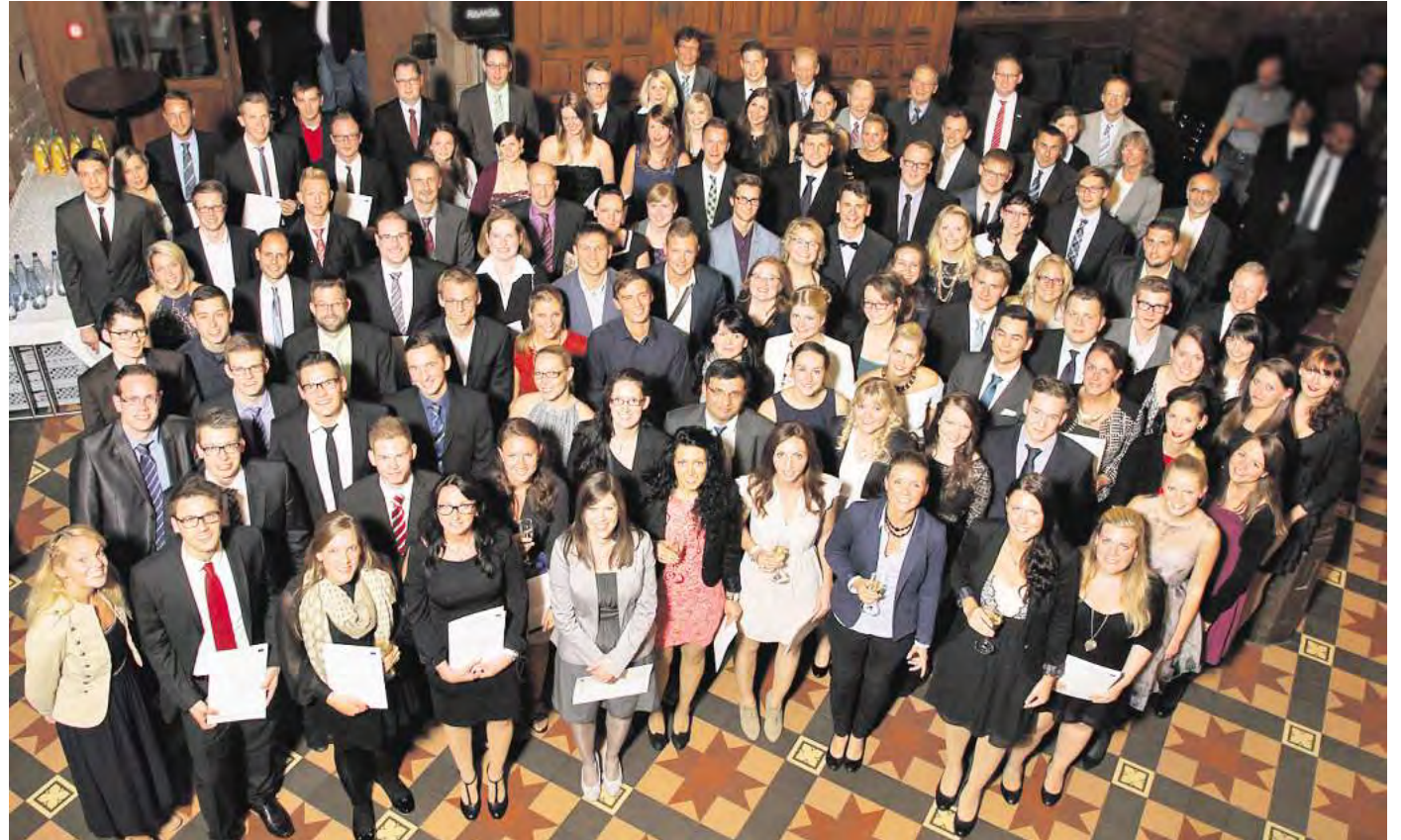
Haben ihr Studium berufsbegleitend geschafft: 118 Absolventen der Berufsakademie und der VWA Göttingen im Alten Rathaus.