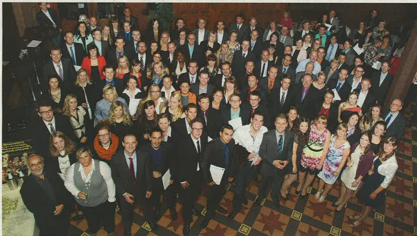
Absolventen, Lehrer und Prüfer im Alten Göttinger Rathaus: Feierliche Zeugnisübergabe und Prämierung der Besten.